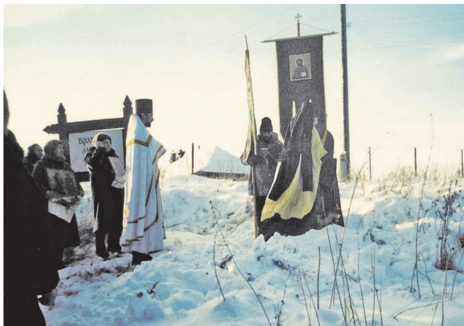
Рис. 5. Панихида на месте братской могилы жертв нашествия, обнаруженной при раскопках 1978 и 1979 гг. Декабрь 1997 г.

Тотальное разорение Старой Рязани, приведшее к прекращению здесь городской жизни, объясняется попыткой рязанских князей сопротивляться и упорством защитников стольного города, принявших первый удар завоевателей, что побудило Батю и его военачальников расправиться с ними с демонстративной жестокостью. Взятие столиц других русских княжеств, таких как Киев или Владимир, также сопровождалось жестокими боями, но городская жизнь в них после нашествия была восстановлена.