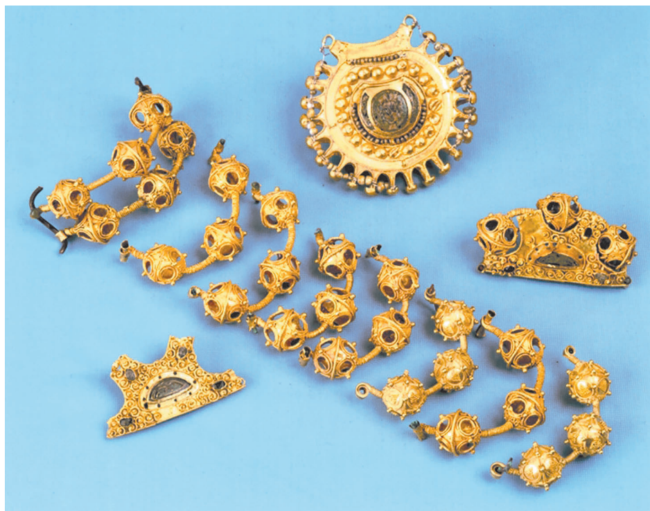
Рис. 2. Комплекс клада 1992 г. (по: Даркевич, Борисевич, 1995 )

дел, председателя Общества истории и древностей российских при Московском университете А.Ф. Малиновского отправился более профильный специалист – К.Ф. Калайдович (1792–1832), знаток славянских рукописей, в том числе наиболее древних. Он также провел небольшие раскопки, причем не только вблизи от места, где был найден клад. Его внимание привлекли холмы, в которых были обнаружены остатки монументальных построек и другие находки. Но, самое важное то, что К.Ф. Калайдович уже в следующем году откликнулся на сенсационную находку публикацией иллюстрированной книги, посвященной драгоценным украшениям клада и другим древностям Рязанской земли ( Калайдович, 1823 ). Такая оперативность отнюдь не была правилом в первой половине XIX в.; она отражала нетерпение общества по отношению к новым данным о русской старине. Это было связано с патриотическим подъемом, вызванным победой в Отечественной войне 1812 г.