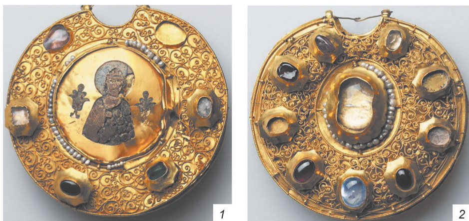
Рис. 1. Золотые украшения из клада 1822 г. (по: Стерлигова , 2021)

именно клад 1822 г. стал украшением Оружейной палаты Московского Кремля, открывающим экспозицию этого собрания.