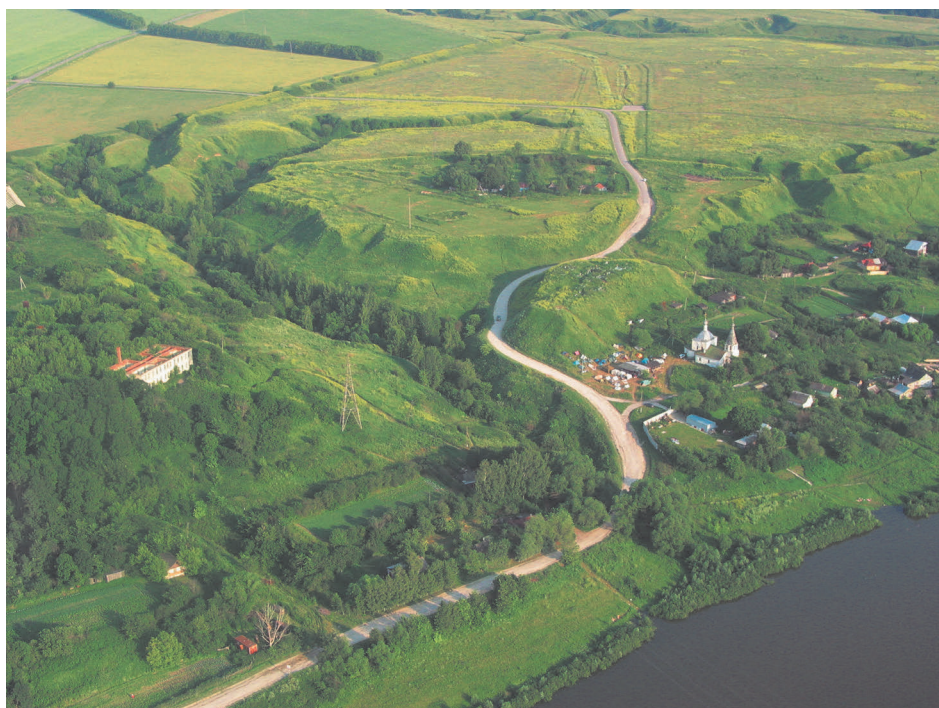
Рис. 6. Панорама городища Старой Рязани. Вид с севера.

Если Старая Рязань не может считаться важнейшим культурным и военно-политическим центром средневековой Руси, то как археологический объект она, несомненно, представляет собой уникальный комплекс. В отличие от других столиц крупных княжеств, Старая Рязань не смогла возродиться на прежнем месте после нашествия и не занята современной городской застройкой, затрудняющей работы археологов в других старинных русских городах. Современный город Рязань (средневековый Переяславль Рязанский) расположен на другом месте, в 50 км от руин древней столицы Рязанской земли. Старая Рязань стала классическим мертвым городом, большая часть ее территории в прямом смысле превратилась в чистое поле, использовавшееся в сельском хозяйстве до 70-х гг. XX в. (рис. 6, 7). Эти обстоятельства открывают перед археологами исключительные перспективы – возможность практически полного изучения городища, превращают его в эталонный памятник археологии (Чернецов, 2012а).