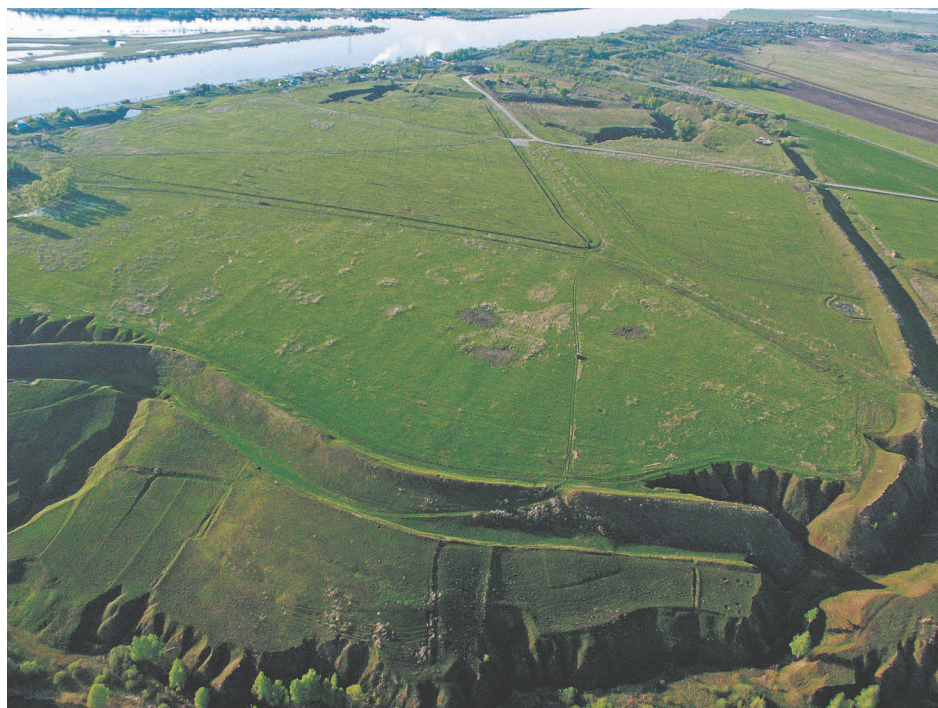
Рис. 7. Панорама городища Старой Рязани. Вид с юга.

В связи с юбилеем знаковой находки 1822 г. из печати вышел ряд посвященных ему статей (Чернецов, Стрикалов, 2020; 2021; Стерлигова, 2021; Strikalov, 2022; Chernetsov, 2022), специальная подборка публикаций в журнале «Российская археология» (Авдусина, 2022; Стерлигова, 2022; Стрикалов, 2022; Чернецов, 2022); с этой датой связана большая часть докладов на конференциях, проведенных в Москве и Рязани (Старая Рязань..., 2020; 2024).