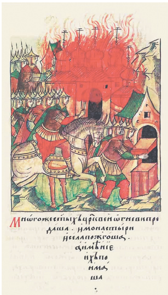
Рис. 4. Взятие Старой Рязани монголами. Сожжение храмов и монастырей, разграбление сокровищ. Миниатюра Лицевого летописного свода. Голицынский том (ОР РНБ. F.IV.225, л. 309 об.)