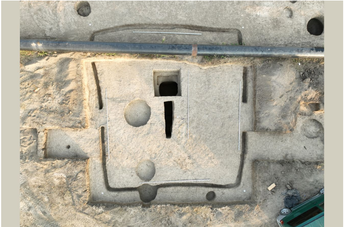
Поселение и могильник Майртупский. Курган VI века, в площади которого фиксируются хозяйственные ямы поселения X–XIII веков