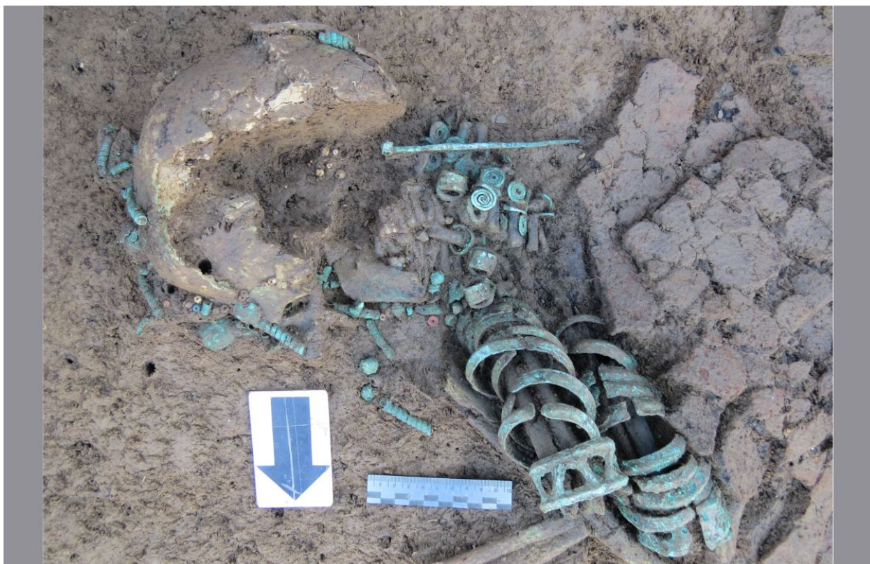
Браслеты и перстни на руках погребенной. Поселение и могильник Хумыкское-2

сегодняшний день поселения этого периода изучены слабо, поскольку основные представления о них базируются на материалах могильников. Раскопки на памятнике Искринское-1 позволили получить новые сведения как о повседневном быте населения, так и о производстве металла в эпоху бронзы.