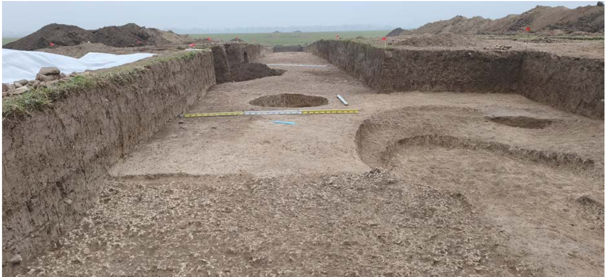
Поселение Тяллинг-2. Участок раскопа с археологическими объектами