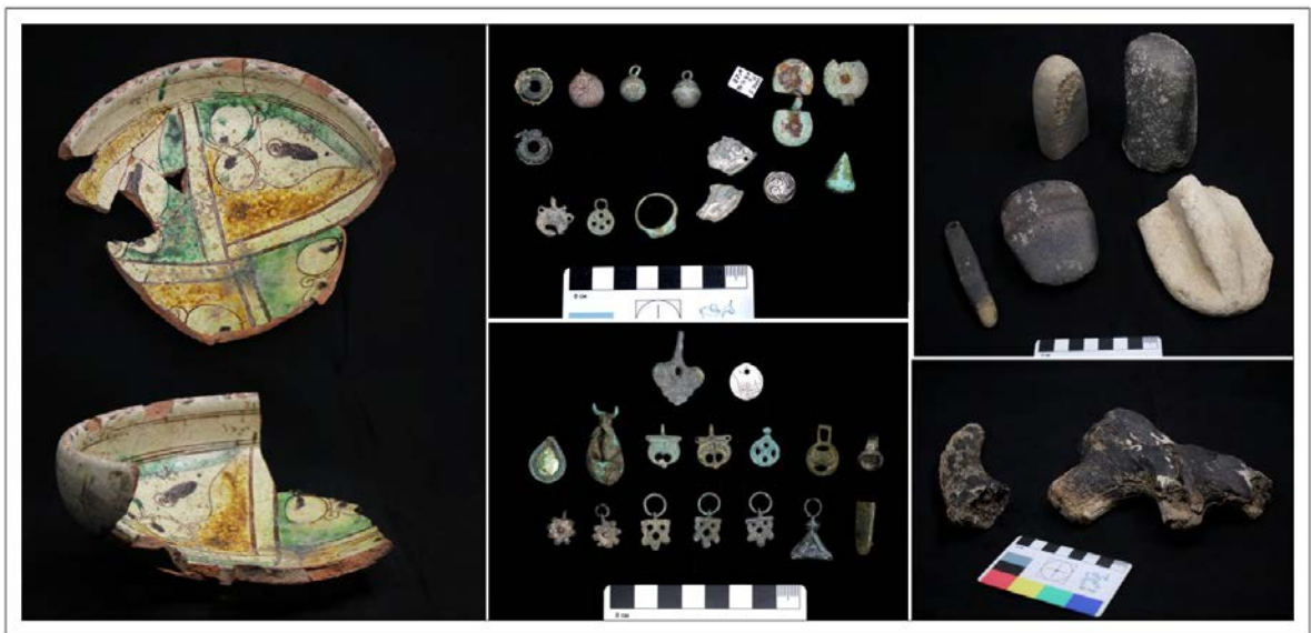
Поселение Искринское-1. Сверху: жилище эпохи бронзы. Внизу слева направо: находки золотоордынского времени: импортная поливная чаша XIV в., украшения и детали костюма. Бытовые и производственные артефакты из жилища эпохи бронзы

В самом большом из найденных сооружений находилось две печи разных типов и несколько тандыров. По-видимому, литейное производство было тесно соединено с повседневным бытом, так как предметы, относящиеся к литейному производству, встречались и в жилых комплексах поселения.