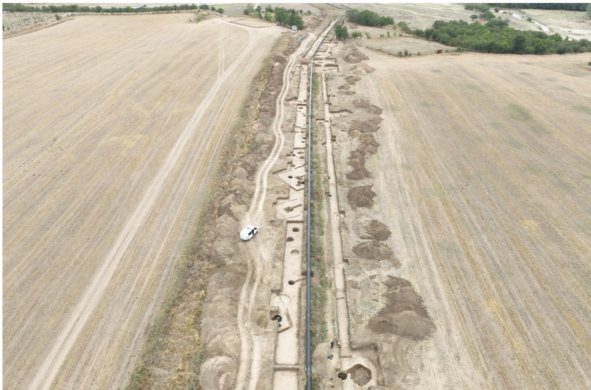
Поселение и могильник Майртупский. Общий вид