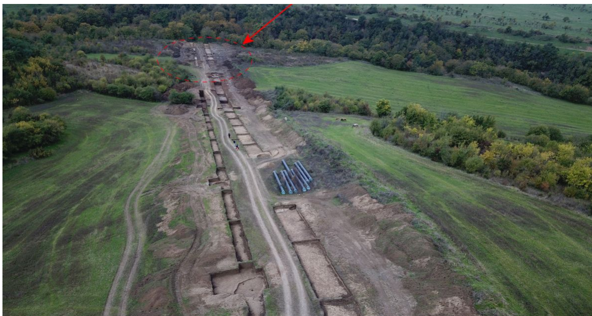
Поселение Искринское-1, вид с востока. Стрелкой обозначен участок поселения эпохи бронзы

В ходе раскопок археологи обнаружили два жилищно-хозяйственных комплекса, хозяйственные ямы. На памятнике были найдены девять объектов предположительно сакрального назначения: это площадки, обмазанные глиной, кострища, алтари и места проведения тризн с остатками керамических сосудов и костями крупного рогатого скота. На этом же участке археологи нашли три погребения. Кроме того, на памятнике собрана большая коллекция находок: фрагменты керамики, орудия из камня и кости, глиняные антропоморфные и зооморфные фигурки, сердоликовые бусы и костяные украшения.