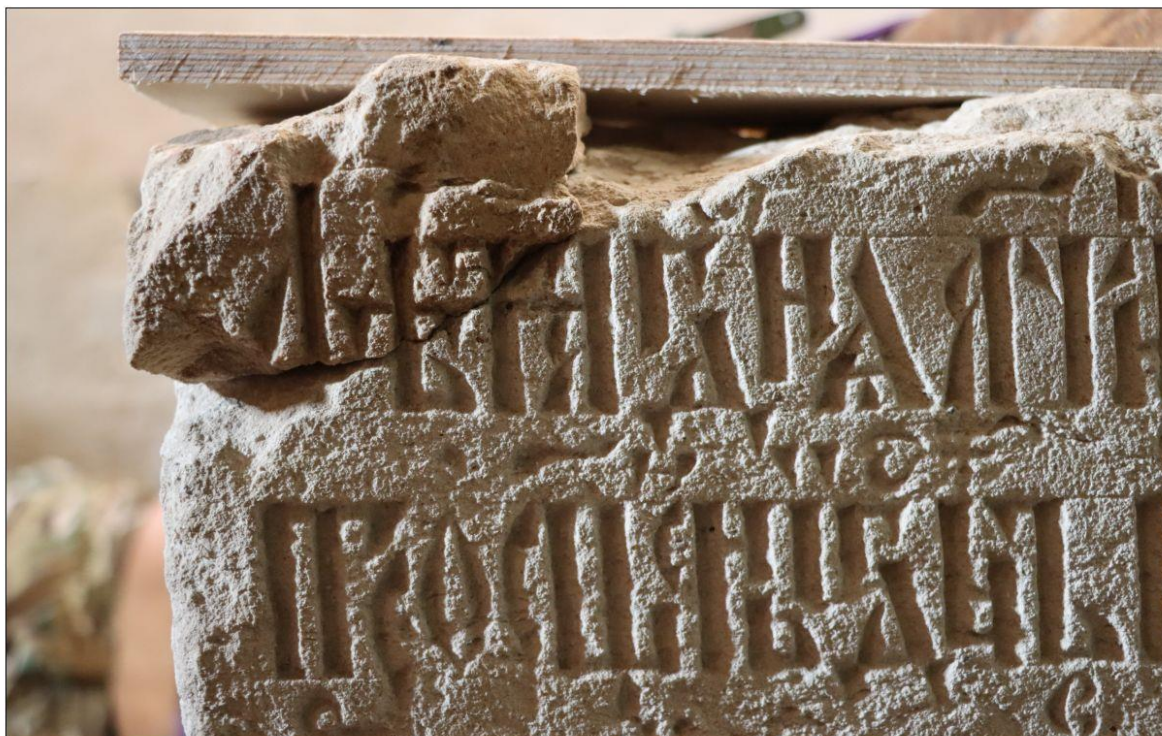
Найденный при расчистке фрагмент надписи на надгробном камне