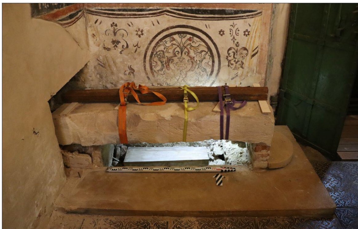
Дощатый гроб 1945 г. под белокаменной плитой

в северной стороне храма. Место упокоения митрополита Илариона всегда было на виду, над его погребением, по преданию, совершались чудеса, ему молились прихожане, прося помощи и заступничества или благодаря за них. В 1982 году он был канонизирован с внесением его имени в Собор Владимирских святых.