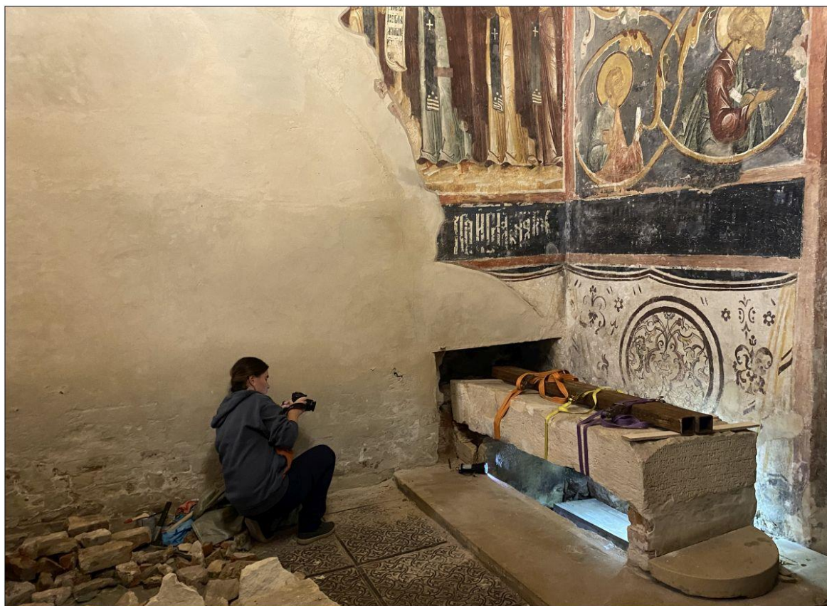
Расчистка погребения. Рабочий момент