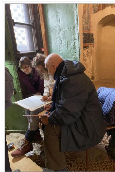
Сверху: надпись на обратной доске крышки гроба. Внизу слева направо: гроб 1945 г., обитый тканью, и доски его крышки с надписью; останки митрополита Иллариона под покровом после вскрытия крышки гроба; специалисты ИА РАН в процессе расчистки погребения

В 2025 году исследование старой гробницы было продолжено. При помощи специально собранной подъемной конструкции реставраторам удалось временно сместить массивную белокаменную плиту, накрывавшую гробницу митрополита Иллариона. Это позволило археологам в полной мере завершить изучение места погребения суздальского иерарха и примыкающую соборную стену с остатками живописи на ней.