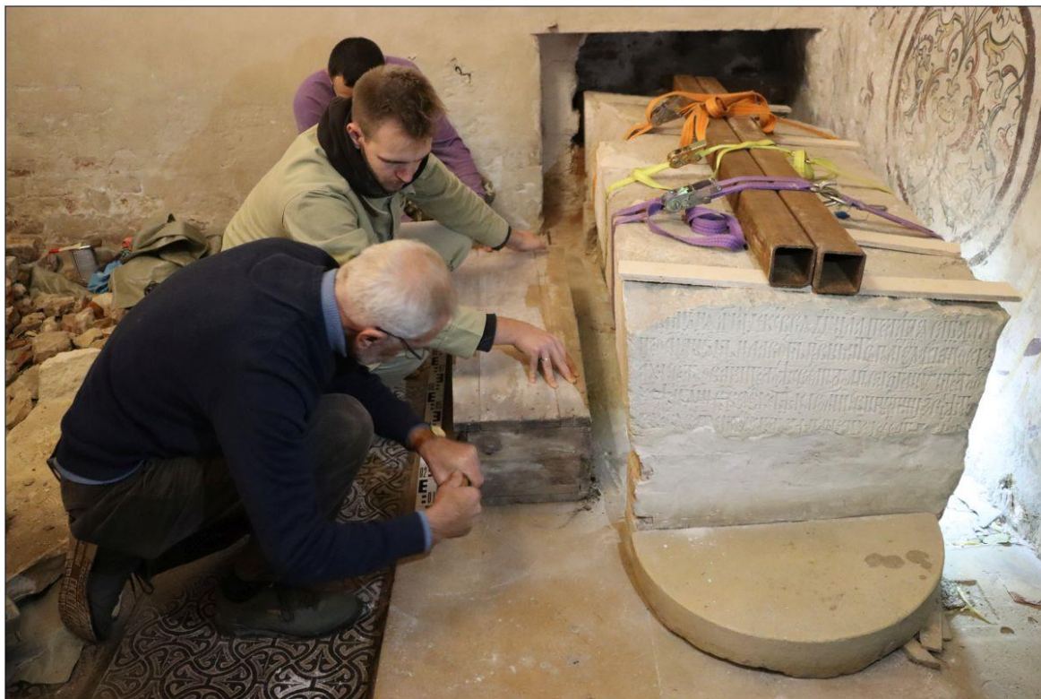
Вскрытие реставраторами извлеченного из-под плиты гроба с останками митрополита Иллариона 16 октября 2024 г.

В октябре 2024 специалисты из Института археологии РАН и епархиальные реставраторы исследовали место погребения митрополита Илариона. Реставраторы разобрали гробницу в северной части собора и освободили надгробную плиту от кирпичных подпорок советского времени. Под кирпичной выкладкой и слоем строительного мусора исследователи обнаружили дощатый ящик длиной 1 м и шириной 40 см.