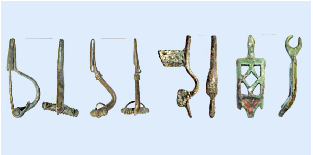
Слева направо: фибулы центральноевропейского происхождения (1-3) и фрагмент звена цепи круга восточноевропейских выемчатых эмалей с памятников середины III века поречья Упы