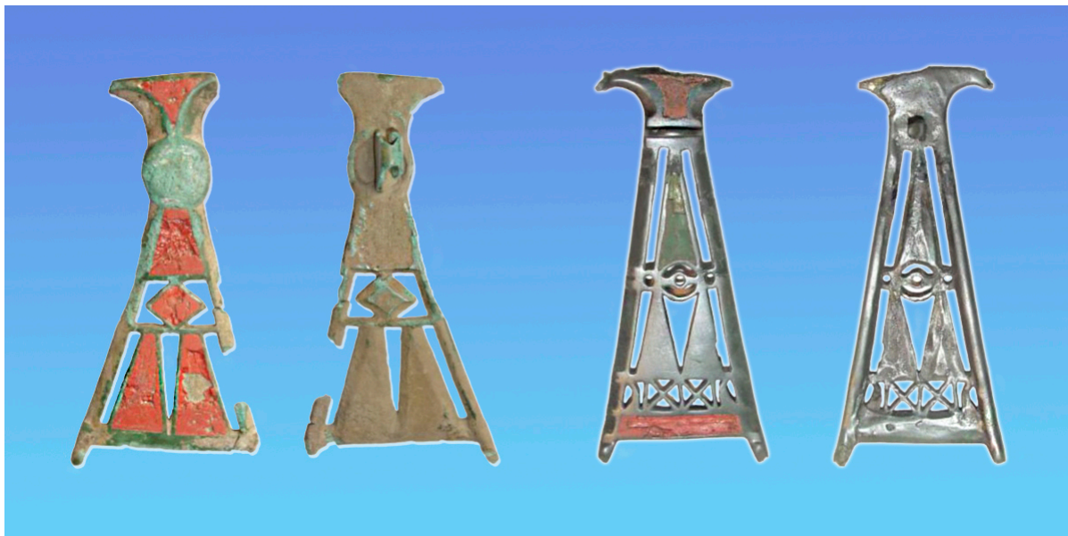
Треугольные фибулы круга восточноевропейских выемчатых эмалей. Памятники середины III века поречья Упы