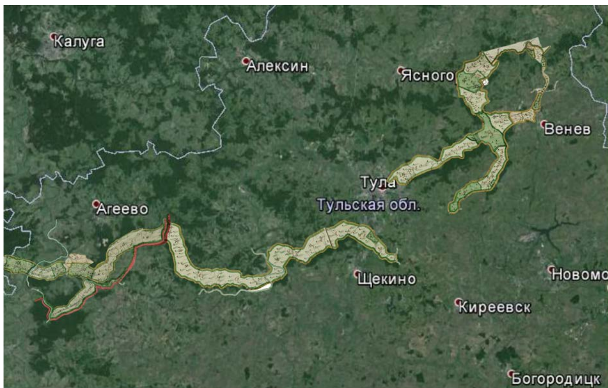
Засечные леса по картографическим материалам XVIII века