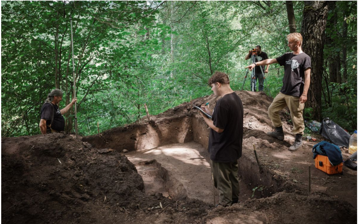
Раскопки на месте находки Барыбинского клада. 2023 г.

Исследования последних лет позволили открыть в зоне лесов многочисленные селища – остатки неукрепленных поселений с наземными постройками, практически не имеющих заглубленных в материк котлованов.