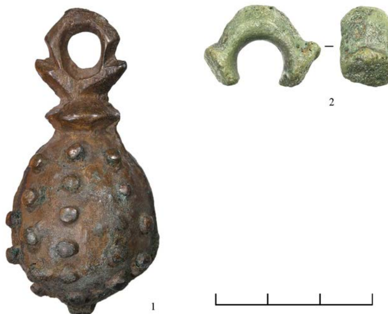
Слева: бронзовая гирька кистеня, селище Спасское городище 7. Справа: петля от бронзовой гирьки кистеня, селище Ивановское 2

Селище, на котором найдена печать Юрия Владимировича, по своему облику, составу находок и материальной культуре не выделяется среди общей массы поселений XII–XIII веков.