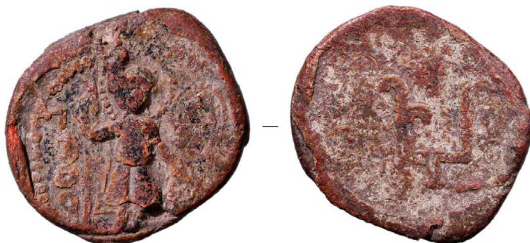
Вислая свинцовая печать Юрия Долгорукого