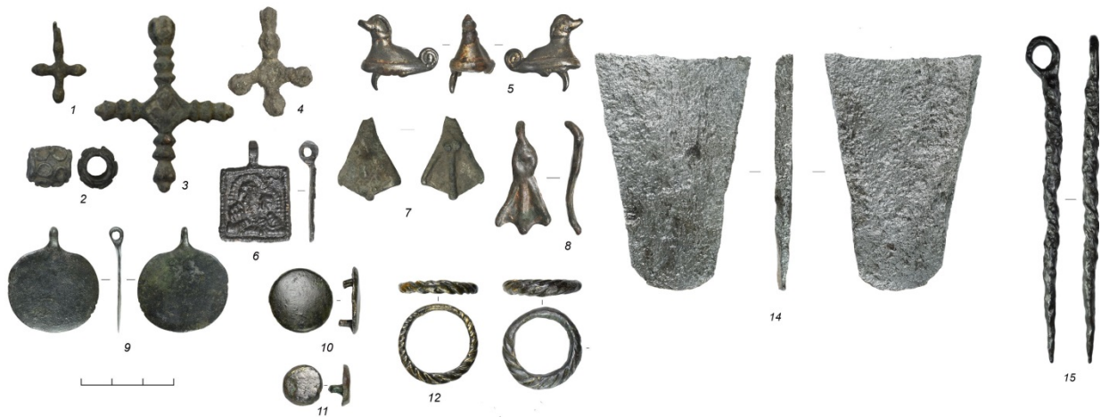
Находки на селище Спасское городище 7

Печать Юрия Долгорукого была обнаружена при обследовании селища Спасское городище 7. Это небольшое поселение, расположенное к югу от Суздаля, на водоразделе рек Нерли и Рпени, у истока речки Карши. Селище было открыто Суздальской экспедицией ИА РАН в 2017 году. В ходе работ 2022 – 2023 годов на селище была собрана большая коллекция находок, датируемых XII – первой половиной XIII века: керамика, бытовые и хозяйственные вещи (железные ножи, пробой, кресало, ключ, шиферное пряслице, свинцовые грузики, пластины и заклепки от котлов) и фрагменты сельскохозяйственных орудий. Археологи нашли множество металлических украшений и детали костюма: бусины, пуговицы-гирьки, монетовидную подвеску, фрагмент подвески-петушка, полую подвеску-уточку и фрагмент подвески в виде двухголового конька, привески, бубенчики, звенья цепочек, фрагменты браслетов, перстни, поясные пряжки, разделительные кольца и накладки. Также найдены выразительные предметы христианского благочестия: фрагмент оплавленного креста-энколпиона, прямоугольная иконка с изображением Богоматери с младенцем и шесть крестов-тельников. Одна находка указывает на связь с военным делом – это целая бронзовая гирька от кистеня. Это довольно редкая находка: при обследовании суздальских селищ найдено всего пять гирек от кистеней, но все они – роговые или железные.