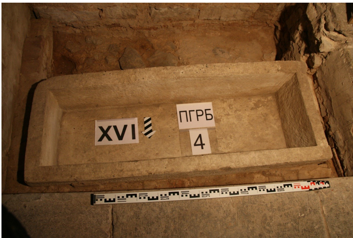
Место погребения княгини Феодосии и князя Федора. Фото 2015 г.

Спустя десять лет после кончины Федора Ярославича в Георгиевском соборе Юрьева монастыря была погребена мать Александра Невского, княгиня Феодосия (инокия Ефросинья). Ее тело положили в саркофаге рядом с сыном – этот саркофаг и сейчас находится в южном нефе собора под деревянным щитом в уровне каменного пола.