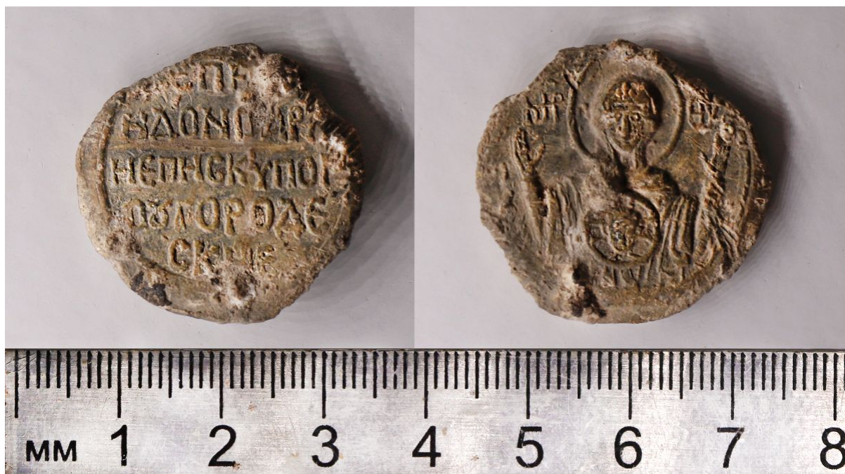
Печать архиепископа Спиридона. Фото 2023 г.

Свинцовая вислая печать, скреплявшая документ от имени архиепископа Спиридона, была найдена сотрудниками Новгородского архитектурно-археологического отряда ИА РАН на территории Юрьева монастыря в одном из раскопов, заложенных к северу от Георгиевского собора. В ходе археологических работ было расчищено глубокое подполье древнерусской жилой постройки XIII–XV веков. Это строение находилось на одном и том же месте два – три столетия подряд, неоднократно горело в пожаре, и, хотя печать была найдена выше слоев XIII века, нет сомнений, что она была сдвинута в более высокие слои в ходе естественных процессов перемещения грунта.