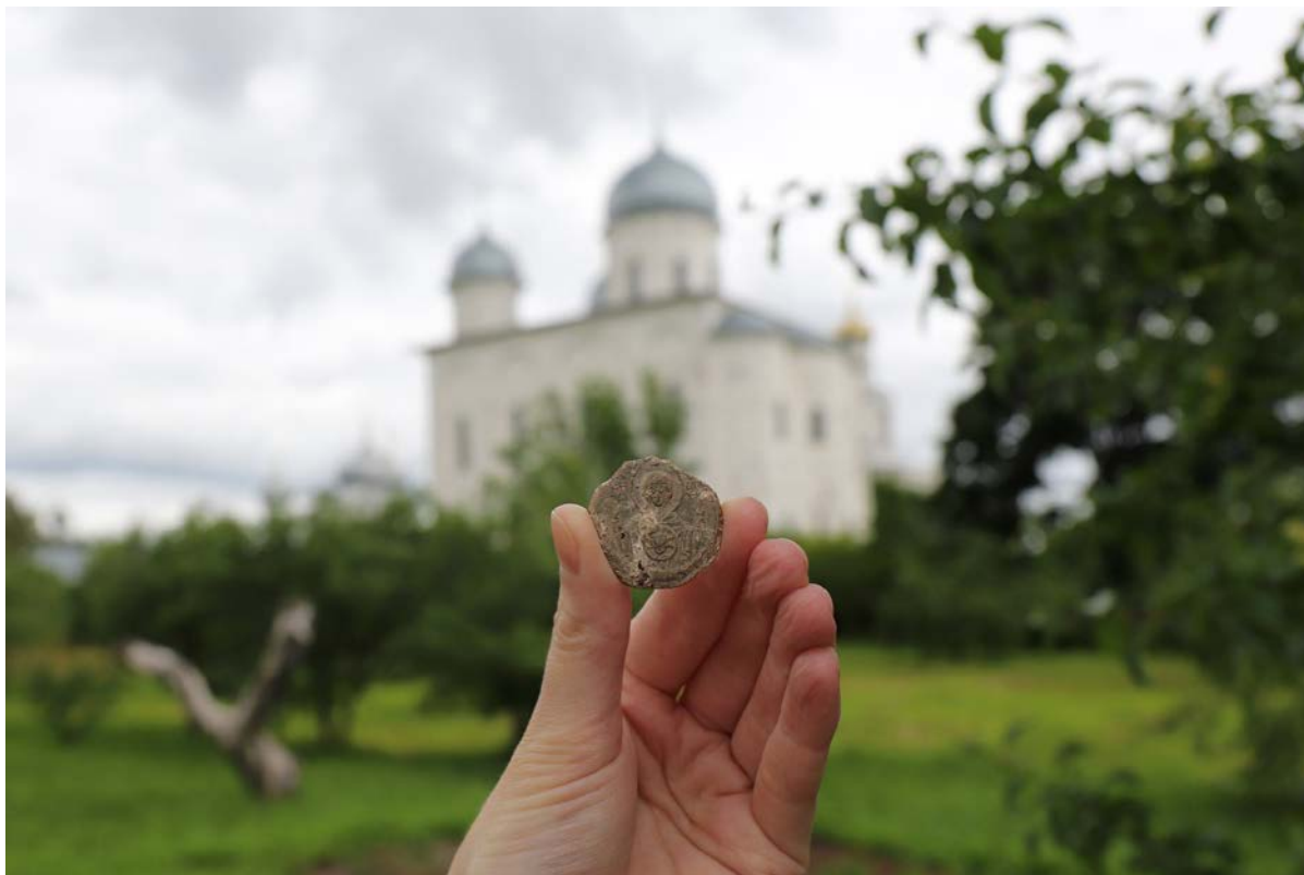
Печать новгородского архиепископа Спиридона из Юрьева монастыря. Фото 2023 г.