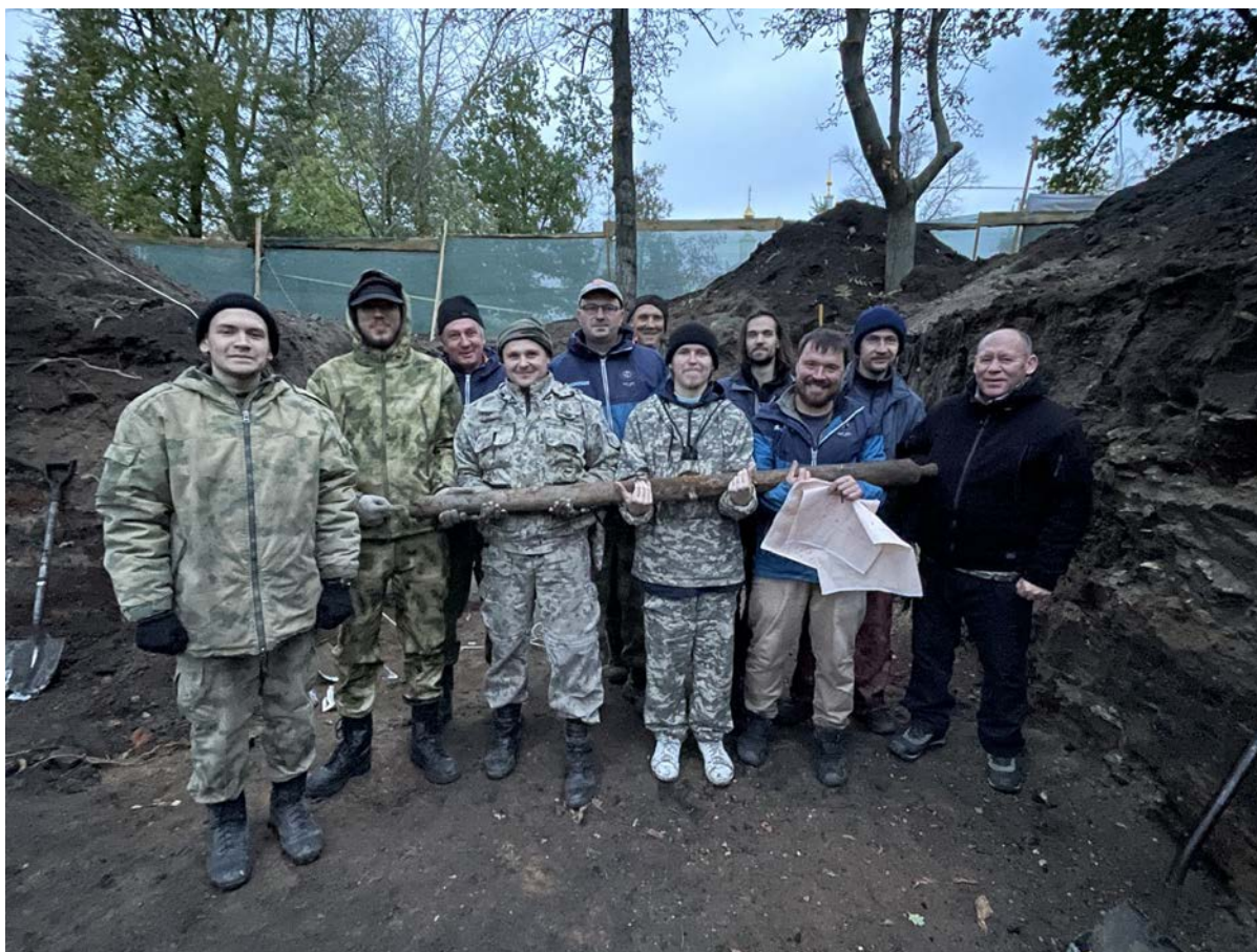
Сотрудники Сейминско-Суджинской экспедиции ИА РАН с найденной пищалью