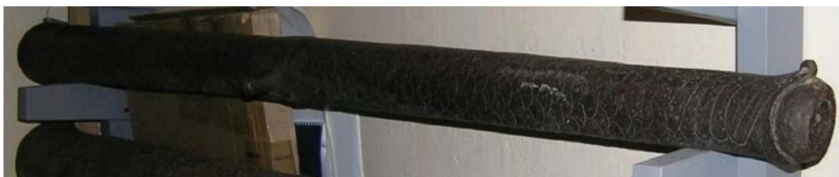
Сверху: орнамент на стволе пищали из Орла. Внизу: пищаль из фондов Угличского государственного историко–архитектурного и художественного музея.

Пищали – орудия для прицельной огневой стрельбы – появились на Руси в XIV веке. Один из крупных центров производства подобных орудий находился в Устюжне Железнопольской (современная Вологодская область). Развитию металлообработки в этом регионе способствовали богатые залежи железной руды, которые находились преимущественно в грунте болот и озер. Такую руду называли «болотной», а места, богатые рудой, получили название «Железного поля».