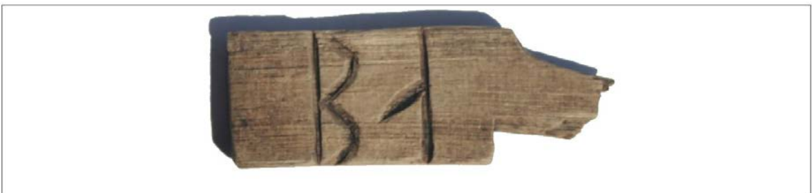
Деревянная бирка с рунами