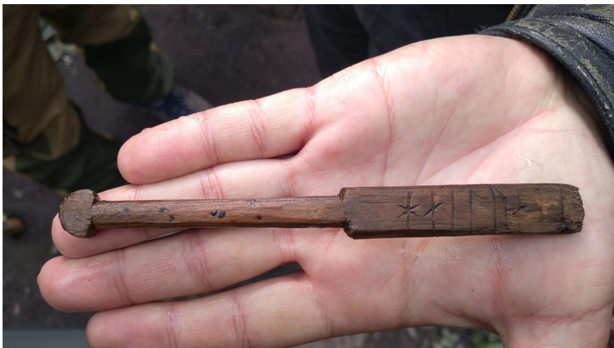
Деревянная бирка с рунической надписью