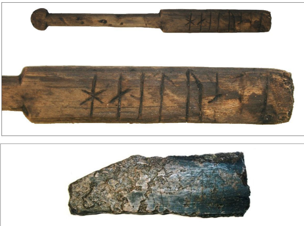
Сверху: бирка в форм меча с рунической надписью. Внизу: фрагмент кости с рунами

К числу редких находок относятся найденные на раскопе пять предметов из кости и дерева со скандинавскими руническими надписями. Это второй случай обнаружения рунических надписей за 90-летнюю историю археологического изучения Новгорода: впервые часть рунического алфавита на кости животного, датируемой первой половиной XI века, была найдена в 1958 году на Неревском раскопе.