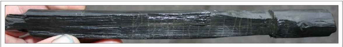
Сверху: фрагмент кости с футарком. Внизу: деревянный предмет с футарком

Еще две надписи представляют собой части футарка – скандинавского рунического алфавита. Одна надпись нанесена глубокими резами на вогнутую сторону ребра крупного рогатого скота, вторая – на деревянный предмет, назначение которого пока не определено. Обе содержат две группы (ætt) футарка, причем в обеих надписях есть общее в начертании рун: искажена ветвь руны u и используется редкая графема руны þ . Все это позволяет предположить, что надписи выполнены одним человеком, не слишком хорошо владевшим руническим письмом.