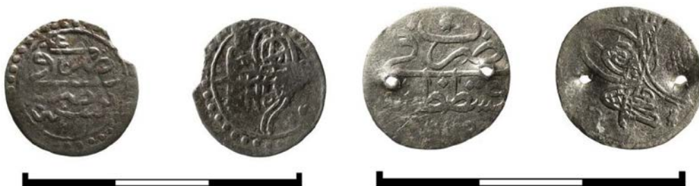
Османские монеты XVIII – XIX вв.