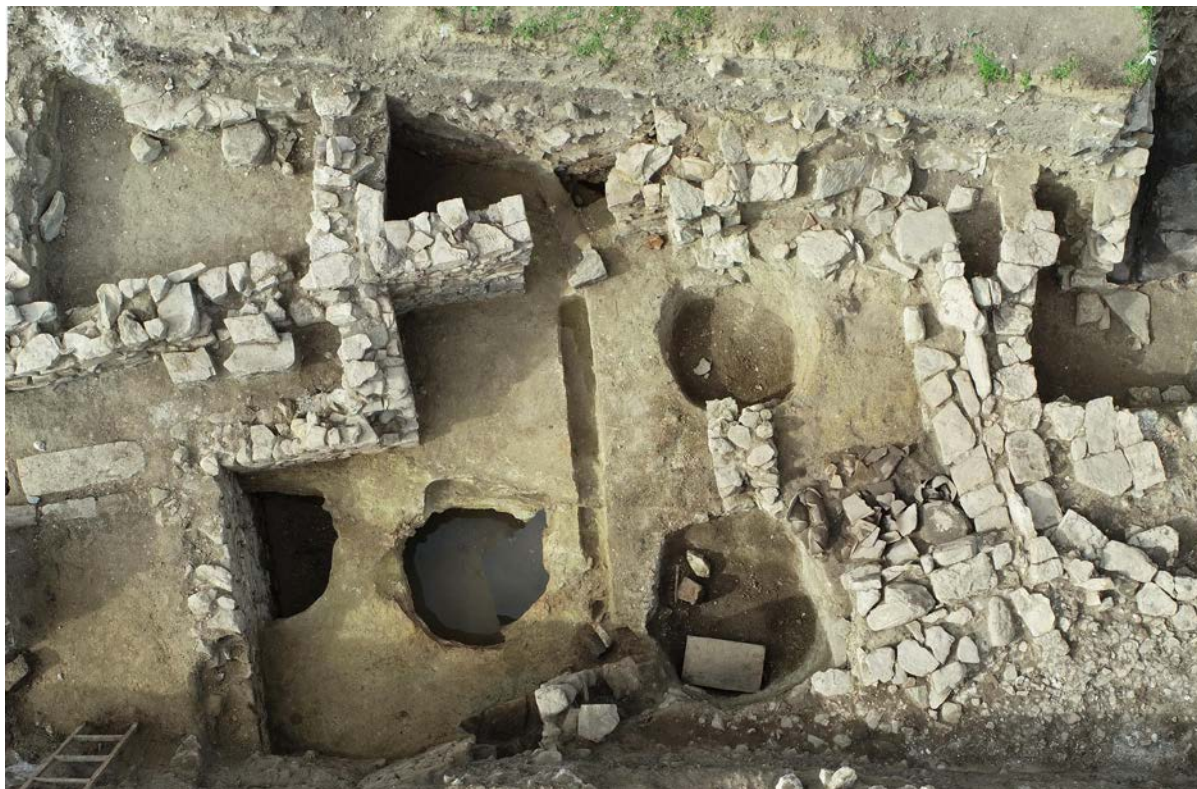
Раскопки усадьбы II – III вв. н.э.