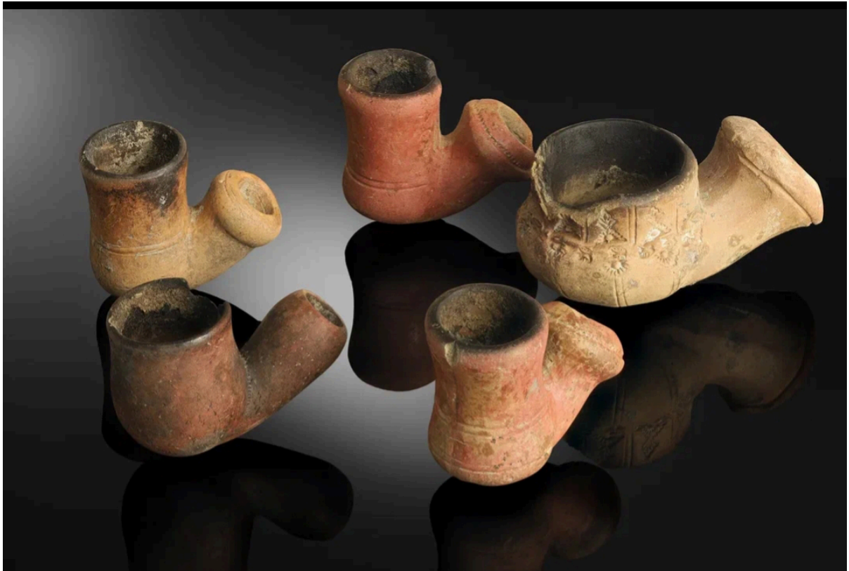
Турецкие курительные трубки XVIII – XIX вв.

Вторая большая группа археологических находок связана с историей ранней Анапы XVIII – XIX веков. Археологи раскрыли следы трех полуземлянок (зимников) и множество хозяйственных ям, связанных с первыми годами жизни Анапской крепости.