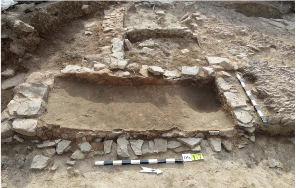
Остатки винодельни III в.н.э.

парадную посуду и оружие. Благодаря этим находкам можно проследить, как постепенно рос город с севера на юг: известно, что греческие погребения всегда находились за пределами города.