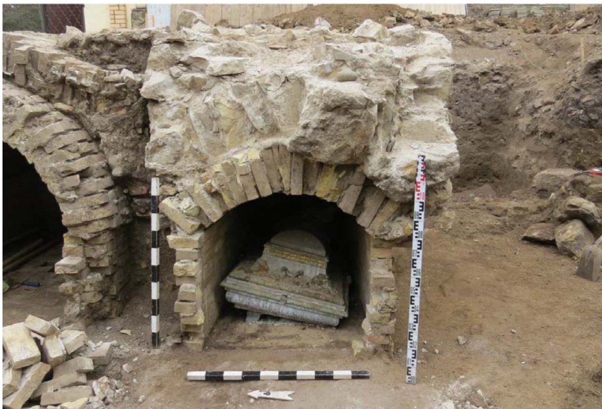
Каменные склепы начала XX в.

Одной из самых интересных находок 2023 года стало открытие участка турецкого некрополя конца XVIII – начала XIX веков, а также двух кирпичных склепов, которые относились к располагавшейся рядом церкви Святого Онуфрия Великого. Один из склепов был разграблен при строительных работах в середине XX века, во втором находилось непо потревоженное погребение священнослужителя.