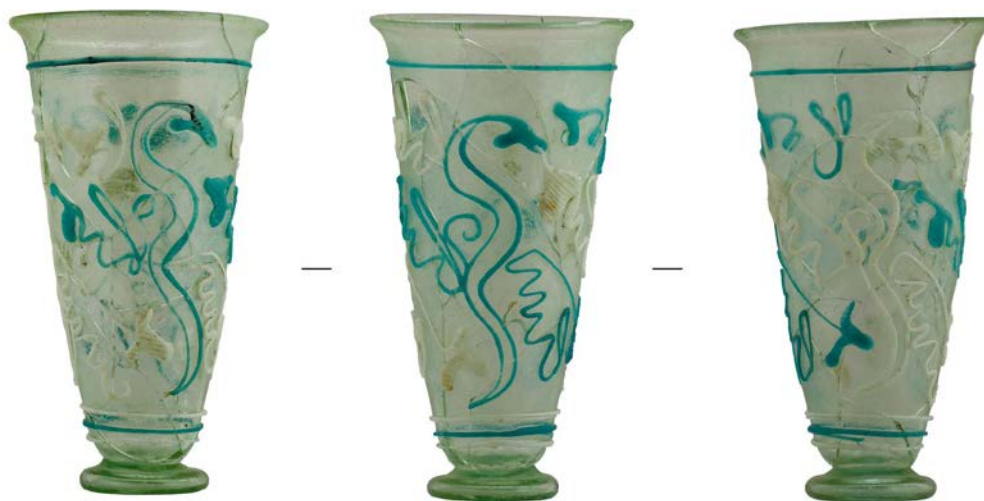
Стеклянный кубок с орнаментом, выполненным накладными «змеевидными» нитями