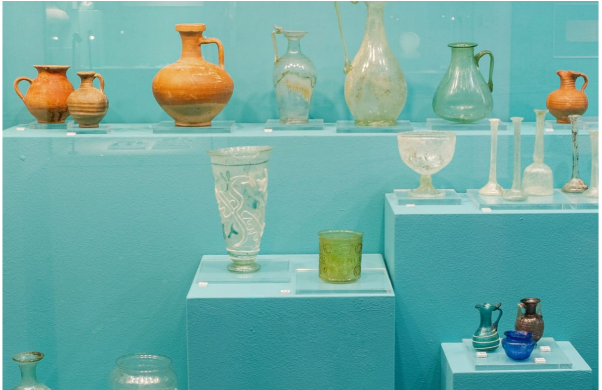
Кубок из некрополя Фронтное 3 на выставке «Мир варваров Таврии и Херсонес, Рим, Византия» Государственного музея заповеднике «Херсонес Таврический»

Пресс-служба Института археологии РАН: press@iaran.ru