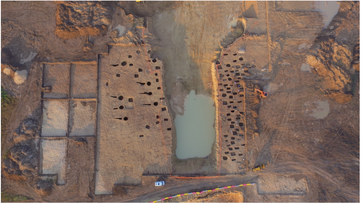
Могильник Фронтное-3. Вид сверху

Стеклянный кубок с орнаментом из цветного стекла был найден в 2018 году в погребении конца II – середины III века могильника Фронтное-3 недалеко от Севастополя. Могильник не был разграблен в древности, как большинство некрополей римского времени, поэтому археологи смогли полностью исследовать его и проследить, как изменялись культура и быт местной варварской общины на протяжении почти 300 лет. Изучение находок показало, что местные жители находились под сильным влиянием Римской империи, главной базой которой в Крыму был Херсонес.