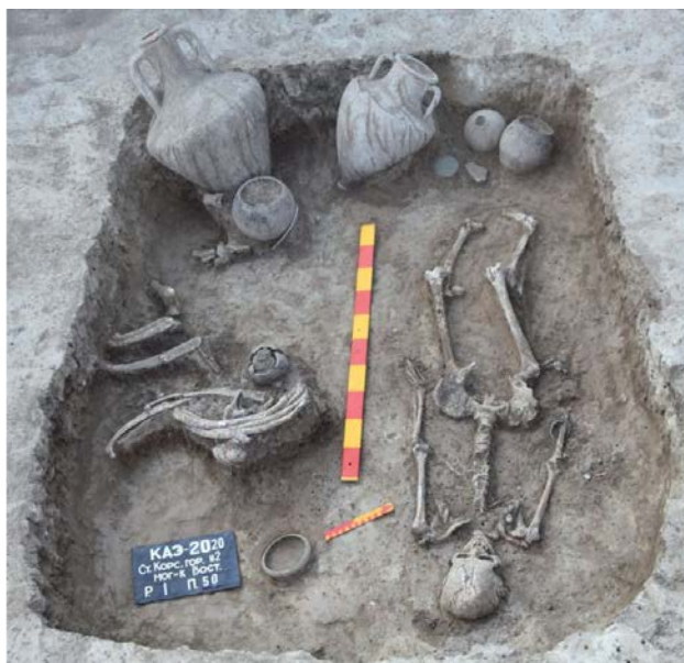
Иллюстрация к статье Елены Кузнецовой, Натальи Лимберис, Ивана Марченко, Сергея Монахова «Погребение с квидскими амфорами из могильника Старокорсунского городища № 2»

Статья: Варка пищи в неолите Плодородного Полумесяца . Автор: Н. Ю. Петрова (ИА РАН).