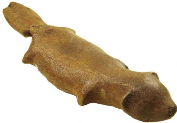
Иллюстрация к статье Тынно Йонукса «Антропоморфные фигуры каменного века из кости и рога из Эстонии – разные стили, разные толкования?»: фигурка бобра

Пресс-служба Института археологии РАН: press@iaran.ru