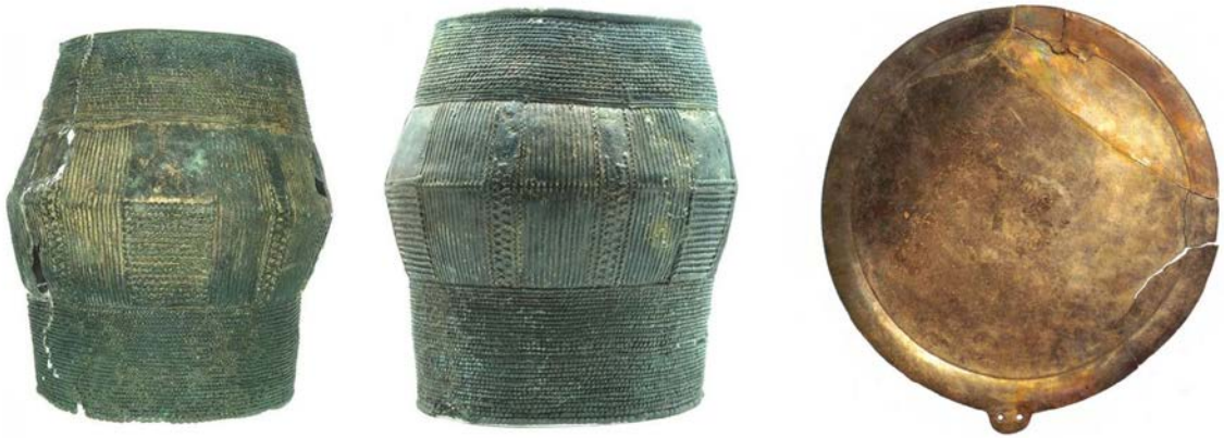
Фрагменты иллюстраций к статье Евгения Столярова, Олега Радюша «Уникальный клад предметов мужской воинской культуры II–I вв. до н. э. с территории Курской области»

Осенью 2017 года жители одного из сел Курской области передали в Государственный музей-заповедник «Куликово поле» предметы, найденные в окрестностях деревни Ванино: два массивных бронзовых браслета, бронзовое зеркало и два железных втульчатых наконечника копий. Археологи, выехавшие на место находки, обнаружили грабительскую яму. В шурфе, заложенном возле ямы, были найдены несколько мелких фрагментов, связанных со втулками железных копий, что подтвердило точность локализации клада. Клад был зарыт менее чем в 50 метрах от памятника археологии – поселения эпохи позднего неолита или ранней бронзы.