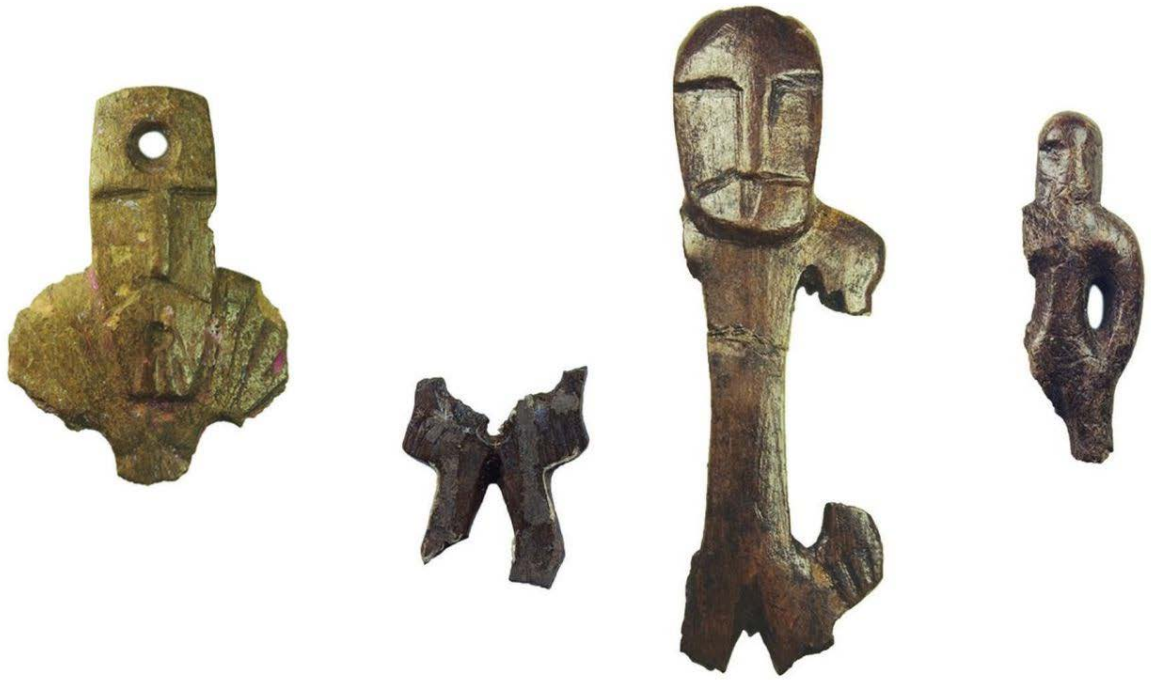
Фрагменты иллюстраций к статье Тынно Йонукса «Антропоморфные фигуры каменного века из кости и рога из Эстонии – разные стили, разные толкования?»

В первые десятилетия XX века на дне реки Пярну были найдены две антропоморфные фигурки, датируемые эпохой мезолита (причем одна из них была утеряна во время Второй мировой войны, сохранилась только газетная фотография низкого качества). Фигурка, вырезанная из рога, представляет символическое изображение человека без четко выделенных конечностей. На лице сглаженными выступами намечены нос и рот, но нет глаз. Возможно, эти детали говорят о том, что фигурка обозначает мертвого человека: его тело завернуто, как при погребении, глаза закрыты. Вопрос, какова была функция этого изображения, на сегодняшний день остается открытым: сопоставление с этнографическими источниками показывает, что на скульптурных изображениях духов-предков, обладающих охранной функцией, как правило, глаза бывают открытыми.