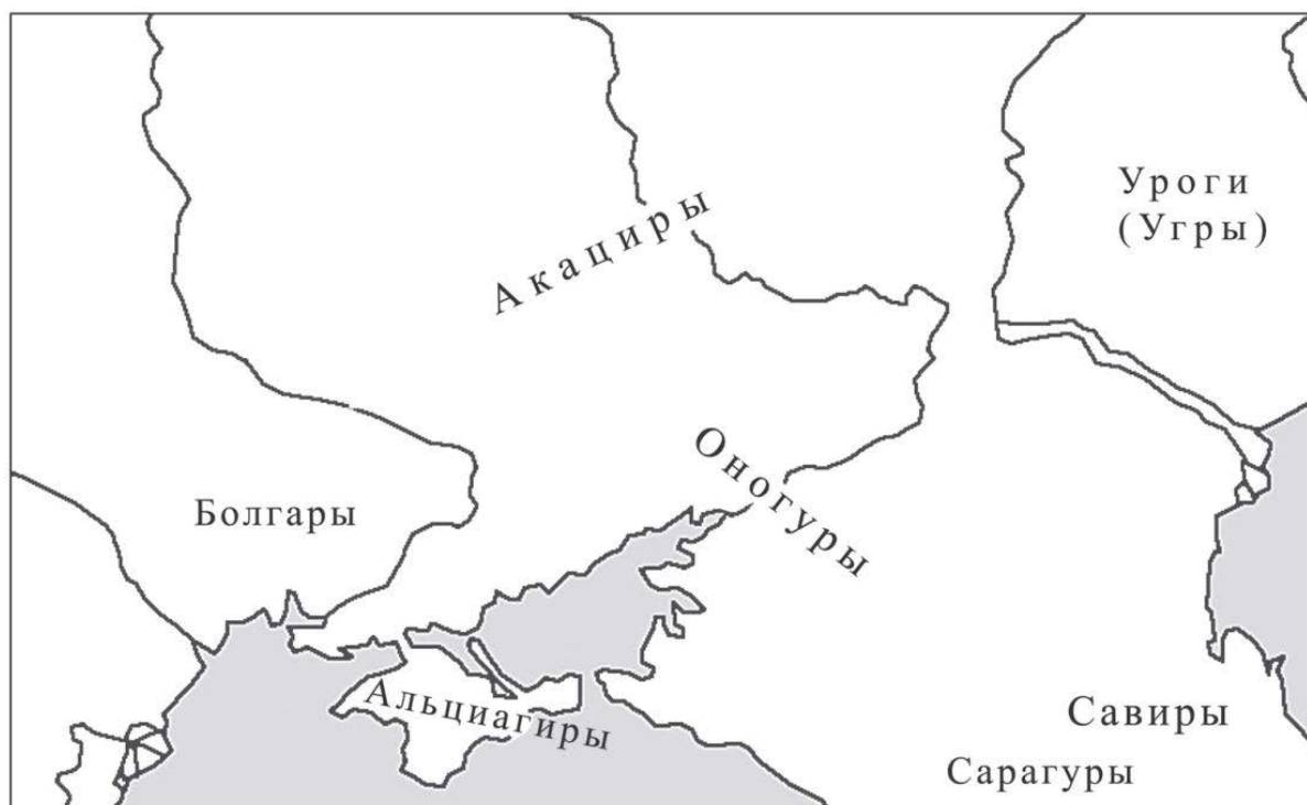
Фрагмент иллюстрации к статье Михаила Казанского, Анны Мастыковой «Акациры: северная окраина кочевой степи после Атиллы»

Об акацирах – гуннском народе, упоминаемом, в частности, в «Готской истории» Приска Панийского – известно, что в эпоху Атиллы они жили в «припонтийской Скифии», на востоке Северного Причерноморья. Позже, около 463 года, в результате войны с сарагурами, оногурами и урогами акациры были вытеснены на север, на окраину степи в бассейне Верхнего и Среднего Дона и на Левобережье Днепра. Готский историк VI века Иордан в «О происхождении и деяниях гетов» сообщает, что акациры – соседи прибалтийских эстиев и болгаров. Где же в действительности жили акациры, и существуют ли археологические свидетельства, указывающие на места их обитания? Возможно, именно этому народу принадлежат погребения в курганах, ямах, иногда со ступенями и подбоями, на северной периферии степи от бассейна Дона до Днепровского Левобережья. Скорее всего, объединение акацир включало в свой состав и оседлые группы варваров, живших на границе со степью, на Верхнем Дону, и носителей рязано-окской культуры.