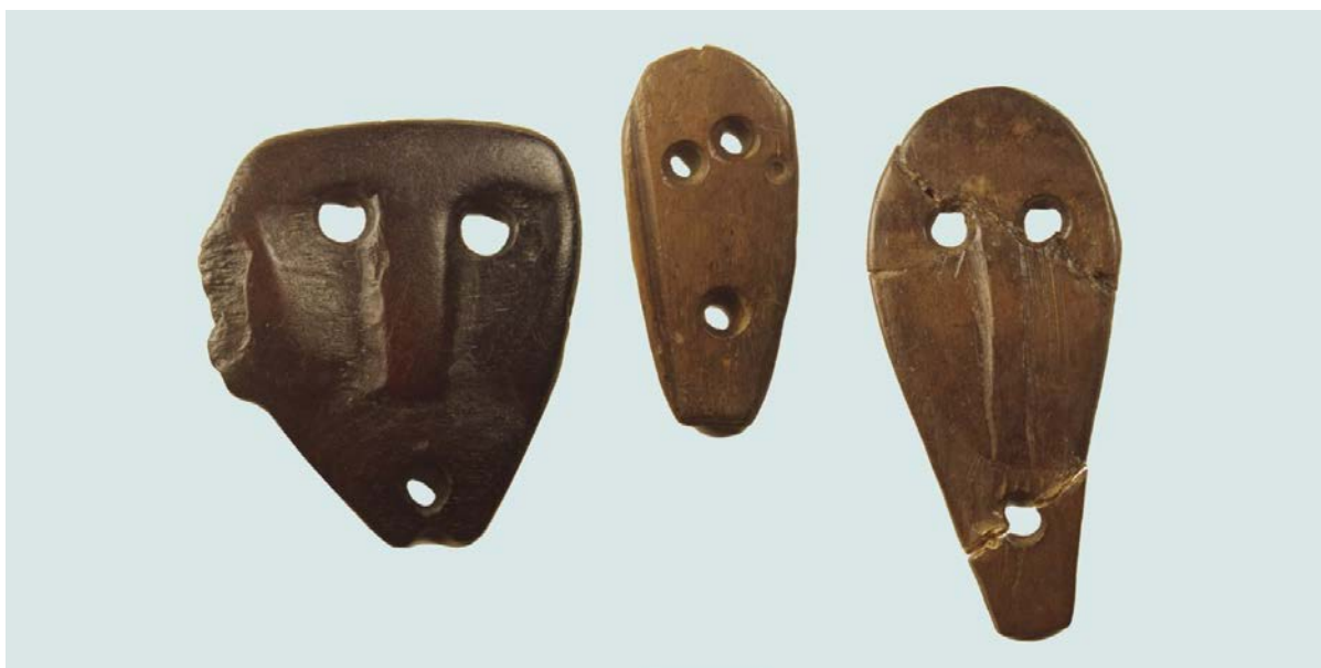
Фрагмент иллюстрации к статье Тынно Йонукса «Антропоморфные фигуры каменного века из кости и рога из Эстонии – разные стили, разные толкования?»