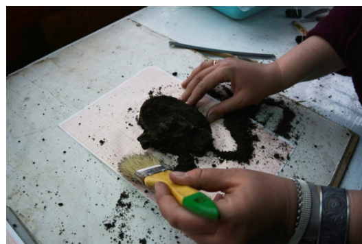
Фиксация места находки и камеральная обработка предметов из клада

Обнаруженный комплекс украшений обладает неоспоримой художественной