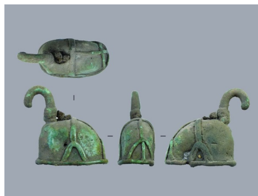
Сверху: Суздальский клад.