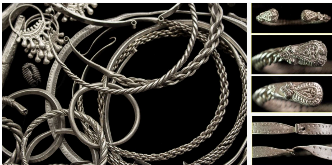
Исадский клад 2021 года. Слева: шейные гривны, браслеты и височные кольца. Справа: головки незамкнутых браслетов, орнаментированные крестами и пальметтами, и крюки шейных гривен с орнаментом «волчий зуб».

Тщательный анализ места находки позволил установить, что клад лежал в небольшом лубяном туеске диаметром 20–22 см, в размер самого большого из предметов – шейной гривны. Клад включал 32 предмета, изготовленных из серебра: 8 шейных гривен, 14 браслетов, 5 семилучевых височных колец, бусину с зернью и денежные гривны новгородского типа. Судя по составу, клад – это скорее не набор предметов от одного костюма, а накопленное богатство.