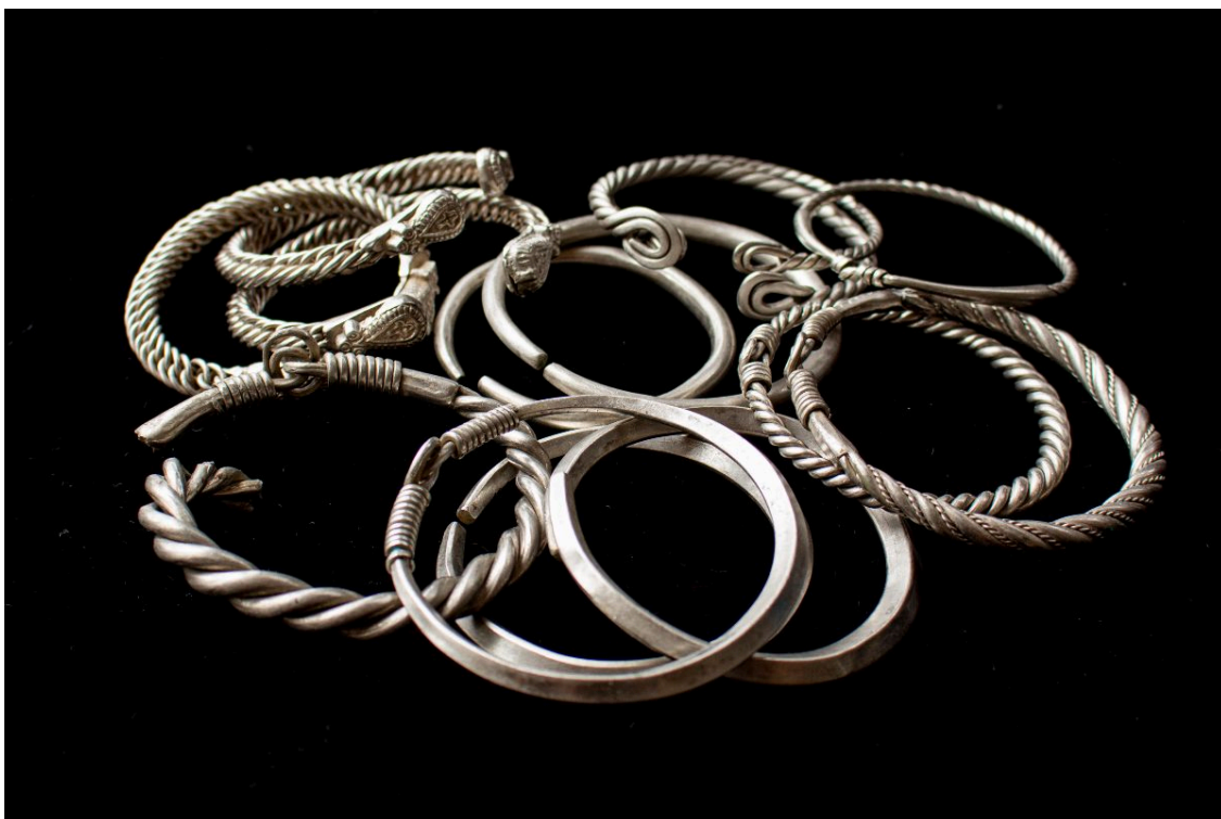
Исадский клад 2021 года. Браслеты.