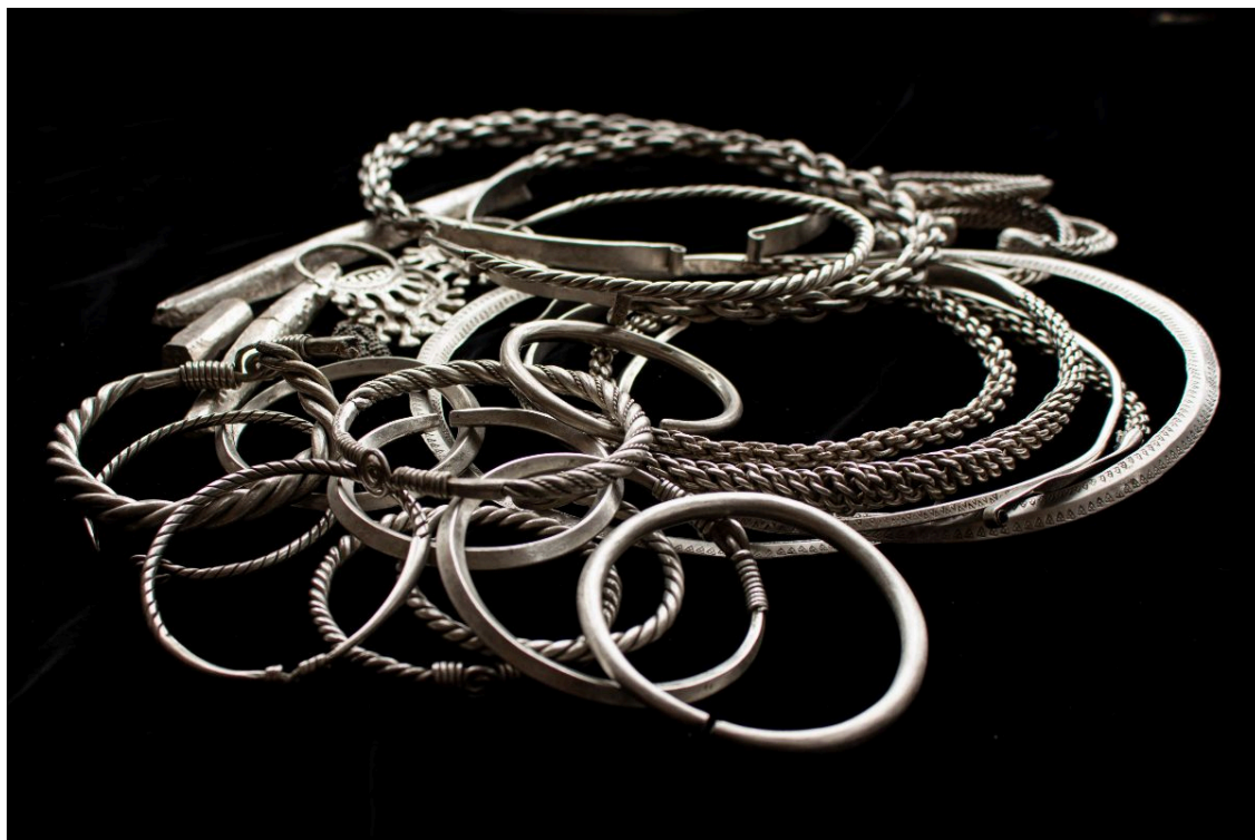
Исадский клад 2021 года.